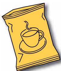
Kaffe-/ snacksposer i plast