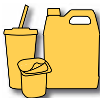
Plastbegre, plastbokser, plastkanner