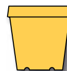
Blomsterpotte i plast