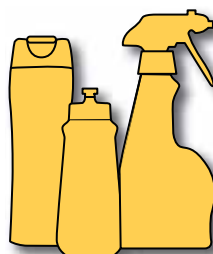
Plastflasker for sjampo, dressing, vaskemidler