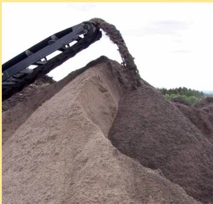
Her blir biomasse, kompostert hageavfall, sand og torv blandet på Heggvin.