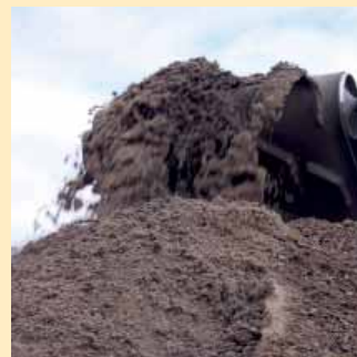
Egenprodusert jord side 5