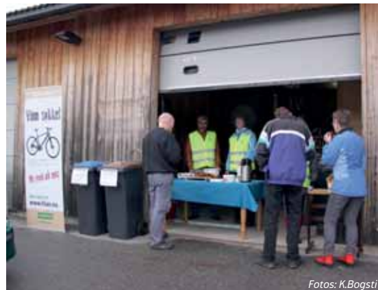
Kaffe, vafler og quiz da Hias arrangerte Superlørdag. Her fra gjenvinningsstasjonen i Brumunddal.

Se svarene på quizen og video av trekningen på www.hias.no