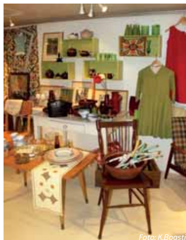
«Oppe og Nede» i Hamar er en av flere butikker i distriktet som selger både redesignet og brukt.

Er du med å arrangerer loppemarked eller selger/formidler brukte og redesignede ting? Da vil vi gjerne høre fra deg. Hias jobber nemlig med å lage en oversikt over hvem som tar imot brukte ting for videreformidling/salg. Send en e-post til gjenbruk@hias.no , eller ring 62 54 37 00 og spør etter Bogsti.