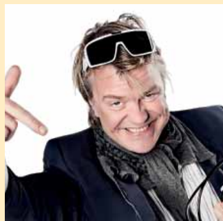
Miljøoptimisten side 3