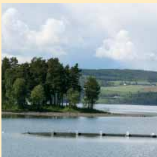
Sjøorm i Mjøsa side 6