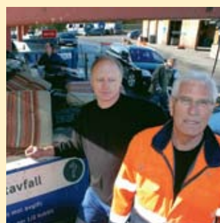
Restavfall side 7