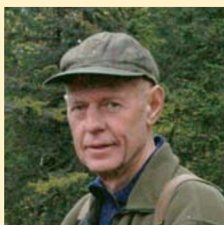
Kildesorteringens far side 3