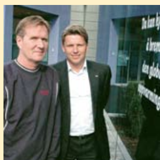
Miljøhotell side 6